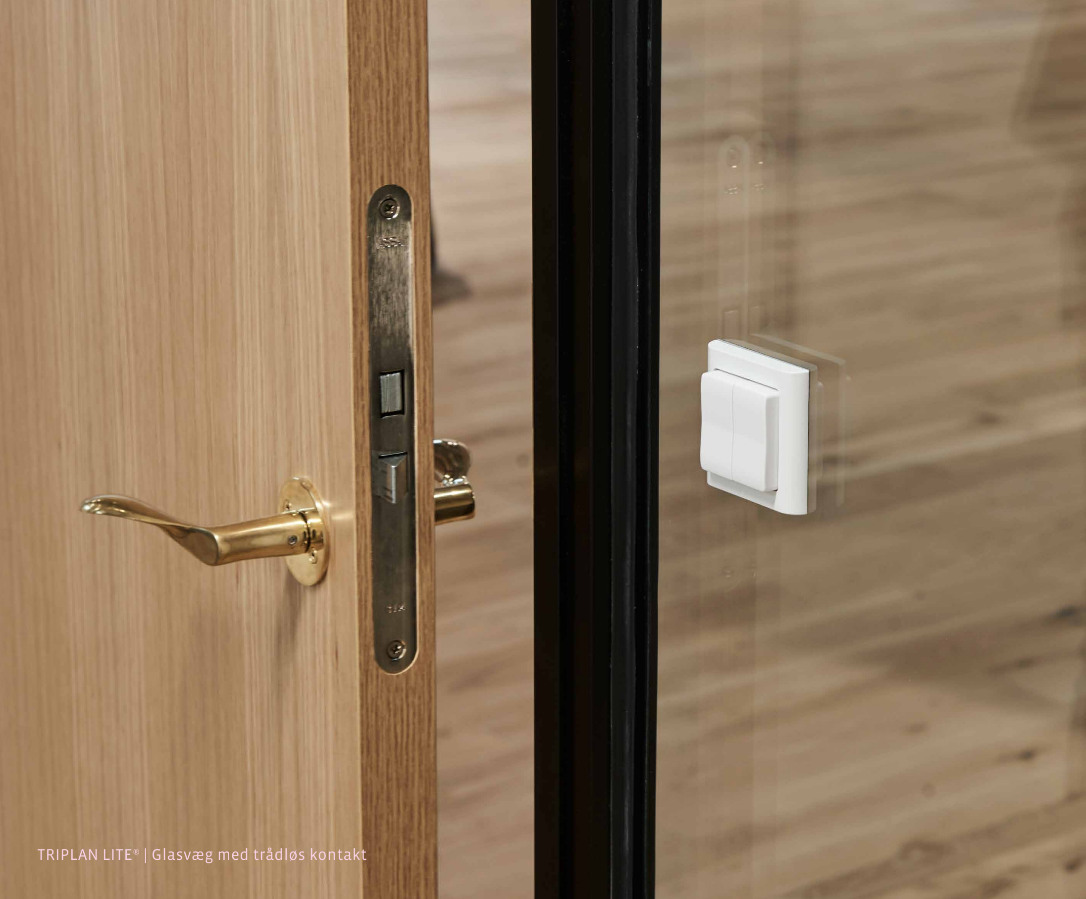
TRIPLAN LITE® | Glasvæg med trådløs kontakt