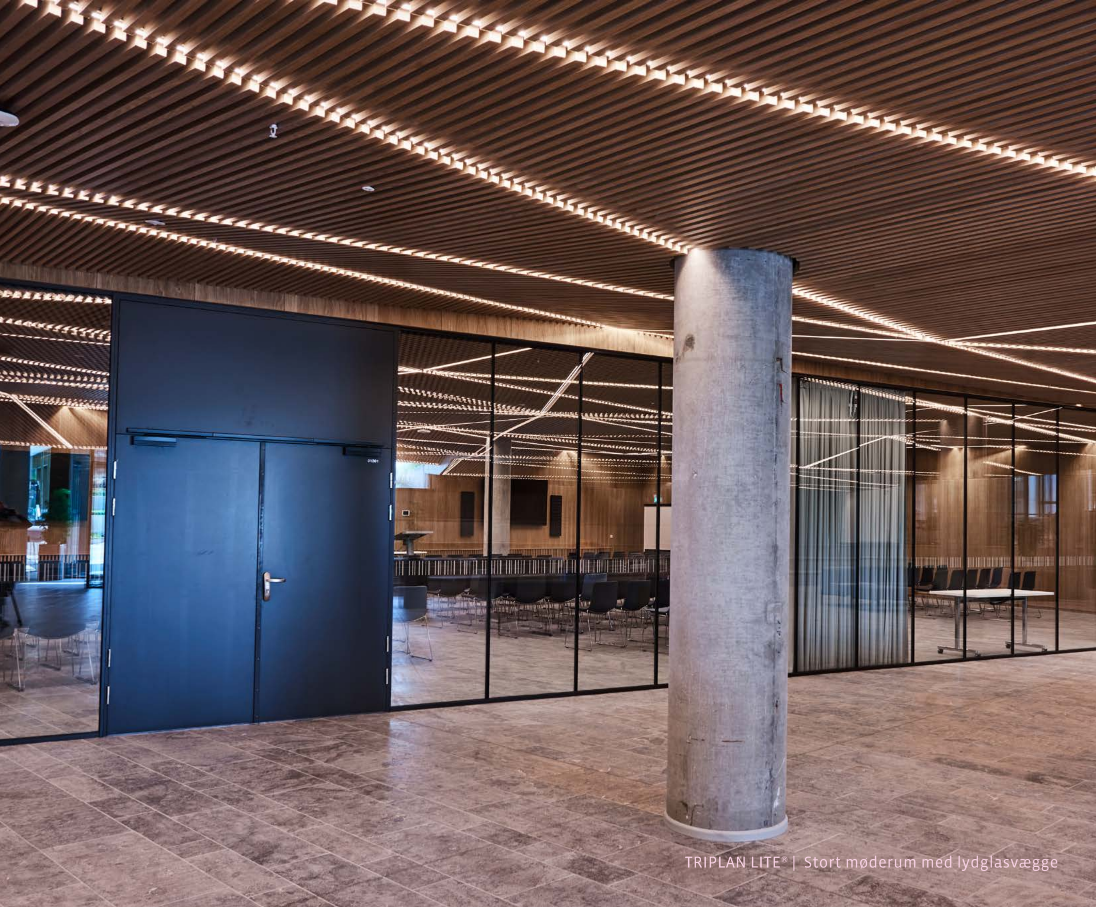
TRIPLAN LITE® | Stort møderum med lydglasvægge