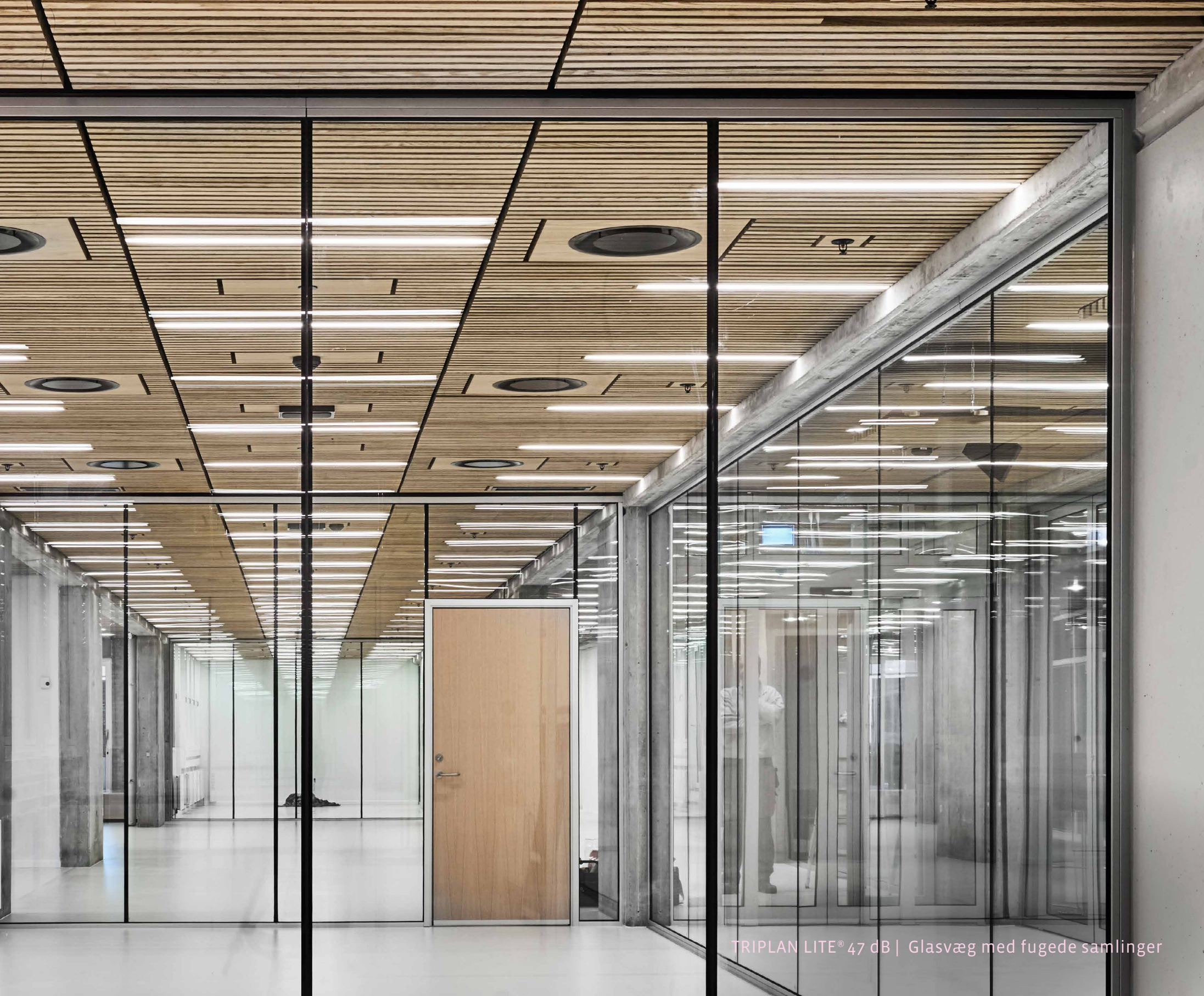
TRIPLAN LITE® 47 dB | Glasvæg med fugede samlinger